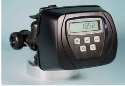
WS1-CI 電子式流量型控 (含 1.5" 以上流量計是選擇配件)