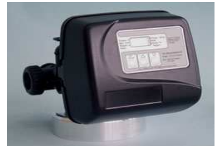
WS1-TC 電子式時間型控制 使用於 1 軟化&砂濾控制器