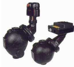
液位控制器-浮球式 ITT