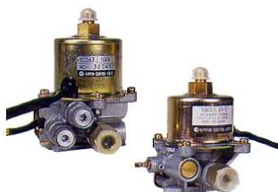
電磁幫浦 NIPON CONTROL